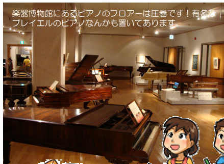
楽器博物館にあるピアノのフロアは圧巻です！有名なフレイエルのピアノなんかも置いてあります